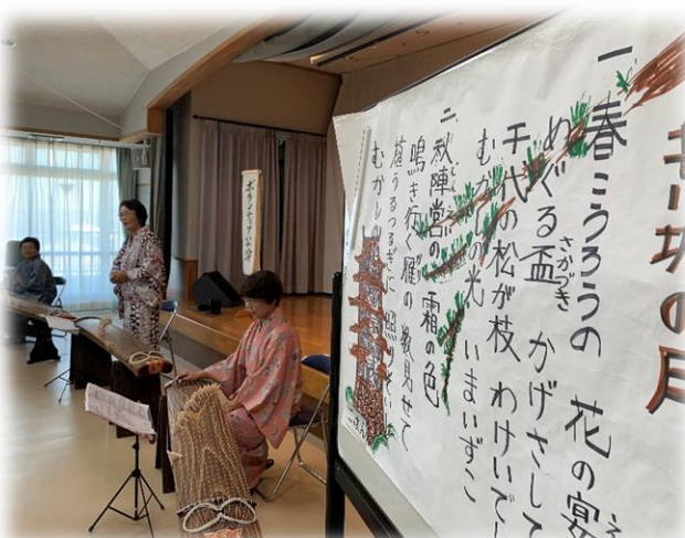
本琴の演奏・着物姿も美しかった

毎年この時期は、多くのボランティア団体の皆さんがこもれびの郷を訪ねて下さいます。皆さんはそれぞれの特技や芸能を駆使して、利用者の方々に娯楽を提供して下さっています。また、6月6日には「ういんぐす」の皆さんが来園されました。バンド演奏あり、お楽しみ会ありとそれ自体がひとつのテレビ番組の様にバラエティに富んだ内容が魅力となっております。