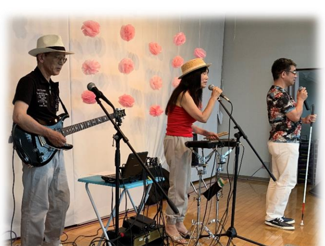
3人組バンド・ファイアフライ