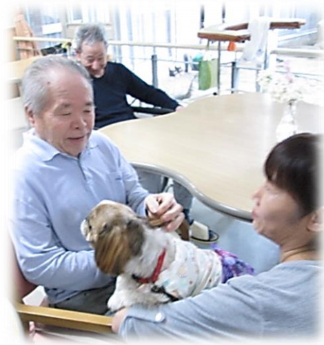
かわいいね！と大人気

トリミングサロン・ニコドッグさんがドッグセラピーで来園されました。多くのワンちゃんとお会いした方が行うボランティア活動です。利用者様だけでなく職員にも大好評です。