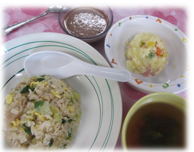
人気メニュー・チャーハン

梅雨が明けたら、いよいよ夏がやってきます。例年通りですが、脱水や熱中症、食中毒などの問題が多くなる時期で、食品の取り扱いにも十分に注意を払っていかないと、食中毒のリスクも高まります。施設内でも、大変中止して回避する必要があります。