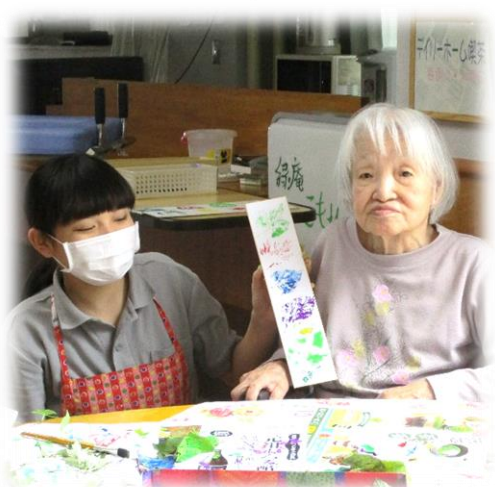
素敵な作品が出来ました