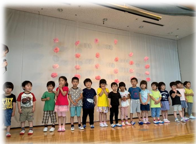
ももぐみ（年中クラス）の皆さんです

こもれびの郷の姉妹園のさくらぎこばんの保育園の皆さんが訪問されました。元気に挨拶され、歌や遊戯で利用者の方々の皆様を楽しませてくれました。