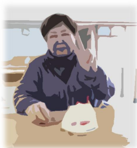
利用者様もアイドルやロックバンドが好き