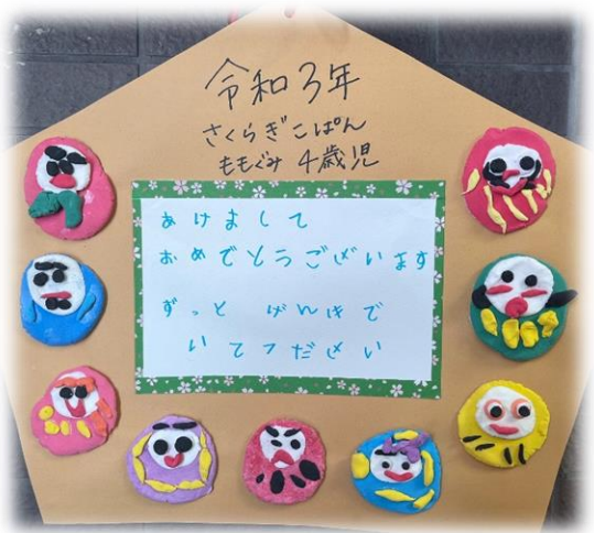
姉妹園 さくらぎ保育園・さくらぎこぼん園児から年賀状

発行者：社会福祉法人さくらぎ会・特別養護老人ホーム こもれびの郷・広報委員 http://www.komorebinosato.or.jp