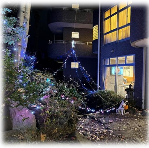
幻想的な風景が楽しめました

からり施設散歩の旅 ファイル172 「イルミネーション」 こもればの郷の中庭「四季の庭」においては今年もクリスマスイルミネーションを行いました。寒い中スタッフが一生涯懸命設置してくれました。