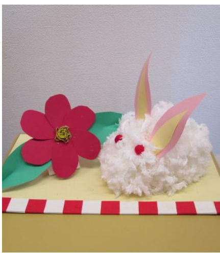
かわいいウサギさん登場