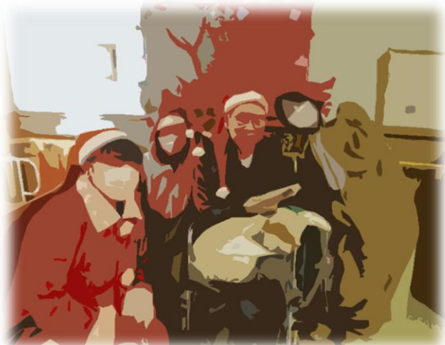
今回は全員が女性スタッフでした