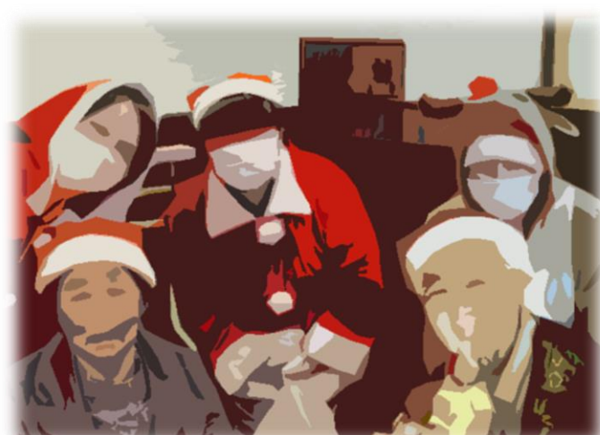
利用者様もコスプレ?で参加

十二月二十三日（水）に恒例のクリスマス会を行いました。サンタクロースとトナカイに扮した余暇委員会のスタッフが館内を回りクリスマス気分を演出してくれたのでした。 サンタ一行の登場に利用者の皆さんは写真の様に笑顔で応えて下さった様子です。（サンタクロースとトナカイさん達がマスクをしておりますが、感冒症等の予防で行っております。ご理解ください。）利用者様の平均年齢は八五歳付近なのですが、クリスマスという戦後の季節行事でも反応はいつも上々です。