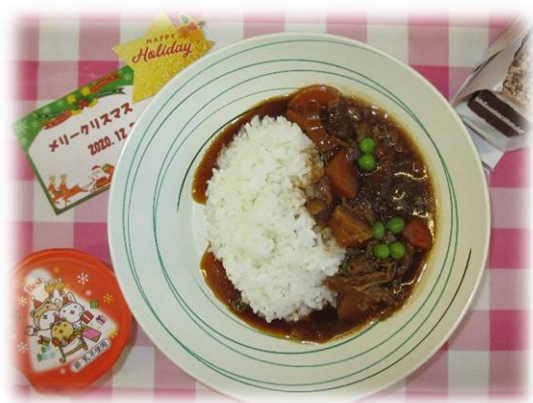
ビーフストロガノフ & クリスマスデザート

コロナ禍で行事やイベント事が縮小される日々が続き、少しさびしさを感じる瞬間もありますが、食事で四季を感じて頂ければと献立を作成しています。少しでも入居者皆様の楽しみになっていたら何よりです。 年が明け、だんだんと寒さが厳しくなってきましたが、空気が澄んだ寒空の下、遠くに立派な富士山が見えると気持ち晴れやかになります。まだまだ寒い日は続きますが、防寒や感染症対策を徹底し、新しい一年のスタートを元気な体で切れるように心がけましょう。