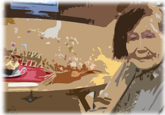
ケーキがおいしそうですね

こもれびの郷では、利用者の方のお誕生日の月に、その方に合わせたお祝い、バースデー企画を行っています。近隣の外出なども可能なのですが、ご時世もあり現在はホーム内での誕生パーティーが人気となっております。早く平和な時代が戻ってくることを祈らずにはいませんね。