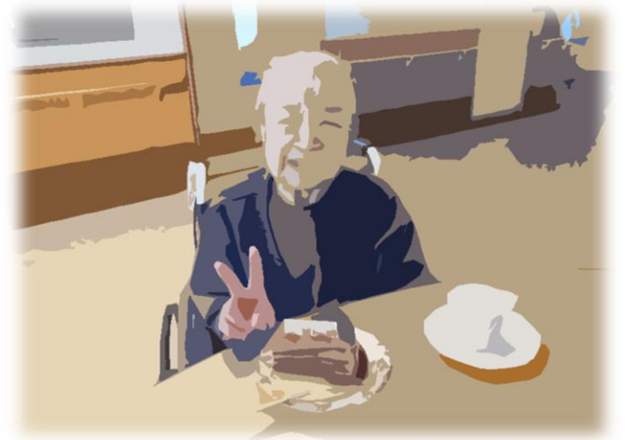
お茶目なポーズで