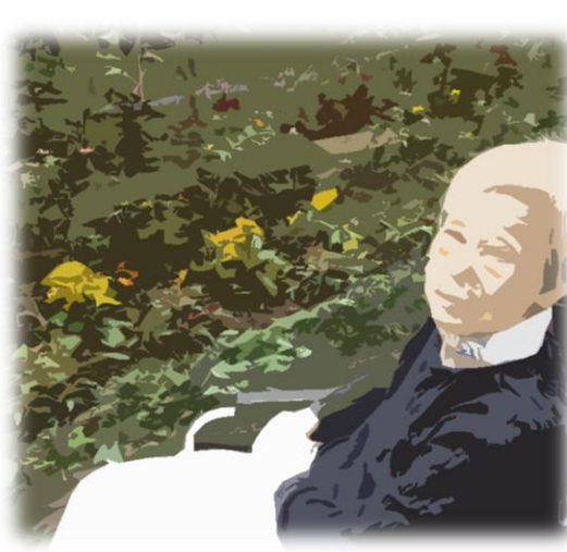
ガーデンプロジェクトがお手入れ

だんだんと寒い季節になってまいりました。たまの外気浴はよい気分転換になります。お庭のさやかな草木が心を癒してくれます。