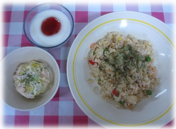
シーフードピラフ さつま芋サラダ ミルクゼリー

肌寒く冷え込む日が続いています。が、秋らしい旬の食材を使った栄養バランスの良いお食事を提供していきたいように、心掛けていきたいと思っております。