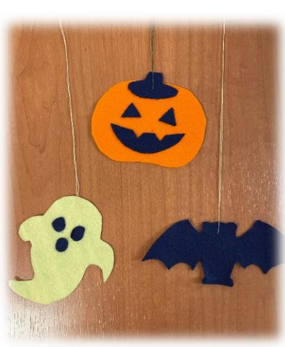
手作りハロウィンマスコット