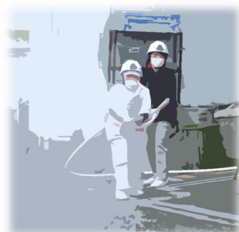
消火栓設備を使い放水訓練

これによって人が少ない時間帯の労働を軽減し、さらに働きやすい職場作りを進めていきたいのです。まずは職員へアイデアを募るアンケートを開始しました。