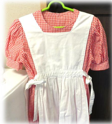
優秀賞・ワンピース付エプロン