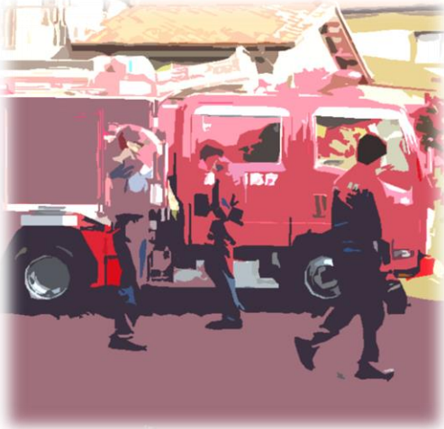
消防車も導入された本格的な訓練

訓練の中にはスタッフが協力して実際の設備を使用した消火訓練も行ないました。これをサポートする他のスタッフもそれぞれが手順通りに行動し役割を果たしました。