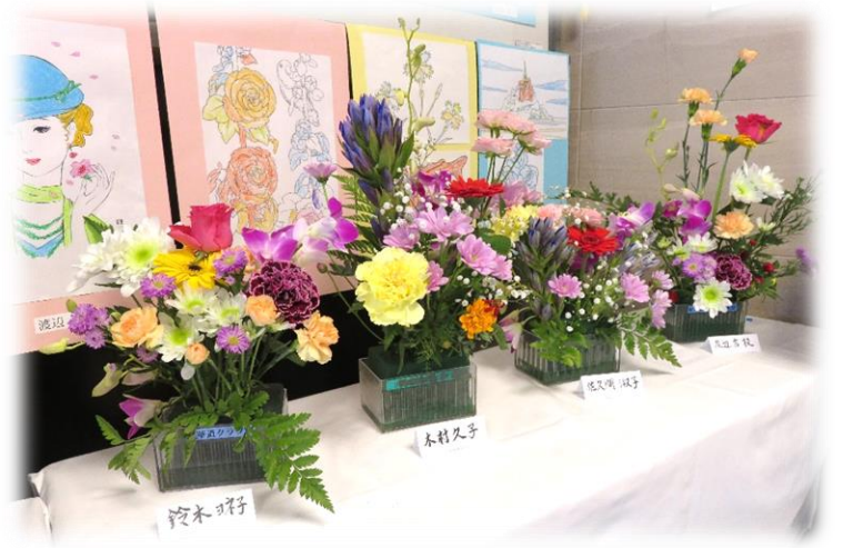
会を彩った華道クラブによる生け花