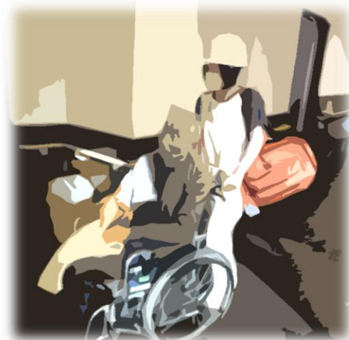
利用者様も訓練に参加

また終了後には、地元みどりの里自治会の方を交え、この地域で災害が起こった場合の相互の援助についての意見交換も行われました。