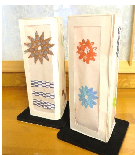
手芸クラブ・行燈