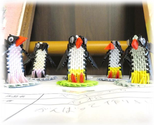
文化祭大賞・おばあちゃんのペンギン