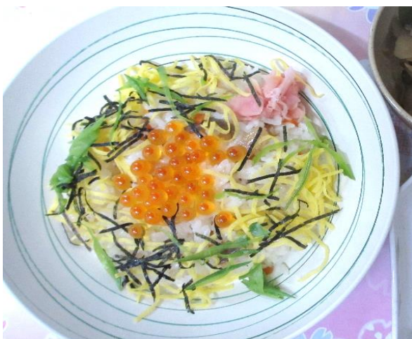
勤労感謝の日「ちらし寿司」

寒さが身に染みるこの時期には、温かい食べ物により美味しく感じます。今後も身体の内側から温まるような食事の提供を目指していきたいと思っております。