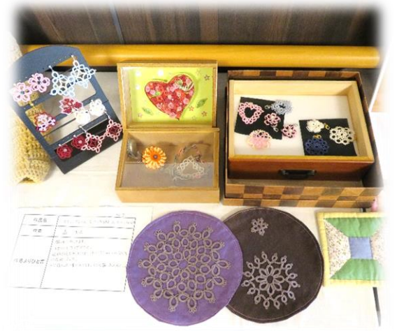
優秀賞・タティングレースつまみ細工他