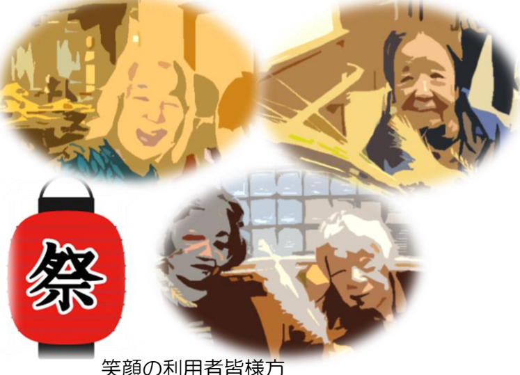
笑顔の利用者皆様方

コロナ第七波の影響で延期となっておりまして納涼祭をようやく秋祭りという形で行うことができました。秋はこれまでの夏の雰囲気と異なり、いままでの夏の雰囲気と異なり、秋らしい演出もそここに散りばめられながら行いました。当日は準備に奔走してくれた入浴委員会のスタッフを中心に、元気なパート職員のおひとりと協力していただき楽しいひと時となりました。お神輿、ひよっとこの登場、そしてあまーい菓子と利用者の皆様にも大変喜んでいただけただようでした。