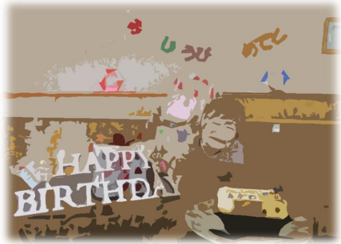
ケーキがおいしそうですね

こもれびの郷では、利用者の皆様のお誕生日の月に、その方に合わせたお祝い、バースデー企画を行っております。 近隣の外出なども可能なのですが、ご時世もあり現在はホーム内での誕生日パーティーが人気となっております。 早く平和な時代が戻ってくることを祈らずにはいませんね。