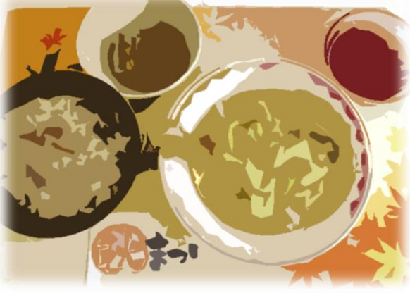
秋祭りの日のメニュー

十月十四日に秋祭りが行われました。例年では夏に納涼祭が行われましたが、今年は感染症拡大の影響により延期となりました。昼食ではきのこのご飯、鮭のちゃんちゃん焼き、南瓜のそぼろ煮、ぶどうゼリーといった秋の味覚をふんだんに取り入れたメニューをお出ししました。利用者の皆様には、旬の食材を使った料理で四季の移ろいを感じて頂けたら嬉しいですね。午前のおやつ時間は綿菓子や午後には今が旬のさつまいもにバターと砂糖を絡めた「さつまいもバター焼き」をお出ししました。当日は、職員が神輿を担いでフロアを回ったりと、お祭りらしい雰囲気を楽しんで頂いたのではないのでしょうか。まだまだ大々的に行事を行うことができませんが、日々の生活で欠かさないお食事の時間で、皆様を笑顔に出来る献立の提供ができればと思います。