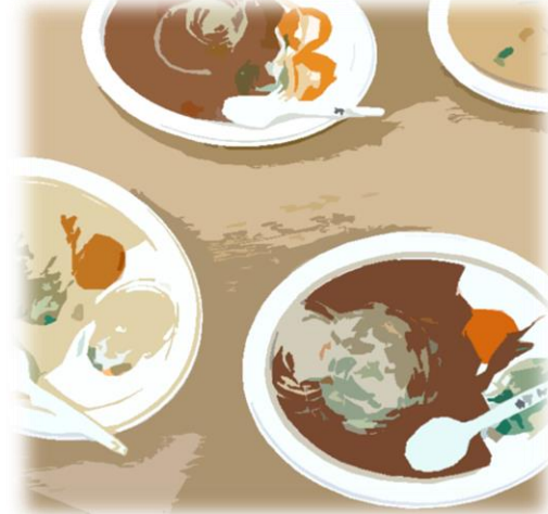
おいしそうなカレー

同法人が運営する保育園「さくらぎこぼん」の作品展を取材してみました。こどもたちの作る作品は夢が詰まっており、見ているだけで楽しくなってきました。