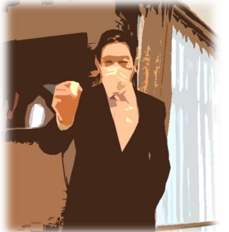
西課長の音頭で乾杯

最後にサービスの在り方の問題です。福祉は昔から「献身」という姿勢が強く求められてきました。それは素晴らしいことではあります。現代ではあくまで対価があつての献身と捉える時代になってきています。利用者様からサービス提供費用をいただいています。これは国が定めており、事業者は個々には設定できません。つまり物資等の値上がり分は基本的には自分たちのサイフの中で解決しなくてはならないのです。努力はいたしますが、今まで出来てきたことで、今後は出来なくなるという事態が出てくるかもしれません。その場合は必ずお伝えしますので、ご理解ご協力の程お願い申し上げます。