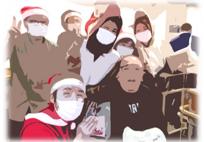
利用者様を囲んで記念撮影

十二月二十五日にこもれびの郷のクリスマス会を行いました。本年も感染症対策を行い、安全のため集合型の行事としては行いませんでした。クリスマス会では、利用者様と職員がサンタとトナカイに扮した職員が館内をまわり、利用者様の皆様に写真を撮りました。その際に、お一人お一人丁寧な記念撮影をさせていただきます。賑やかな時間を共にすることが、利用者様の皆様に喜んでいただくことで、利用者の皆様に