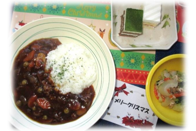
クリスマスメニュー (ビーフストロガノフ、サラダ、ケーキ)

調理室より 総務課栄養調理室 一同 新年明けましておめでとうございます。謹んでお慶び申し上げます。本年も厨房職員一同、お食事がある日々の楽しみの一つとなつて頂けるような提供を目標とし、日々精進していくたいと思っております。本年もよろしくお祈り致します。 昨年十二月二十五日の昼食にクリスマスメニューをお出ししました。ビーフストロガノフにライスを添え、鮮やかなサラダをお付けしました。また、クリスマス気分を盛り上げるためにデザートには二色のケーキをお付けしました。利用者様の皆様には大変喜んでいただきました。 世間ではだいたいイベントごとがコロナ前の様な形に戻ってきましたが、季節はまだまだ寒く簡単には外出できません。利用者様の皆様には、毎日の献立で季節を感じて頂けるように、お食事の作成に努めてまいります。毎日の献立がご利用者の皆様のお楽しみとなつていきたいと思います。新年も元気な体で過ごせるよう、引き続き寒さ対策や感染症予防に努