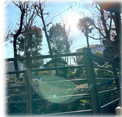
安全性の高いステンレス製に

こもれびの郷「四季の庭」には、井戸水をくみ上げて、庭の上段にある大岩から滝を造り流している池があります。柵が老朽化しておりましたが、今回刷新いたしました。