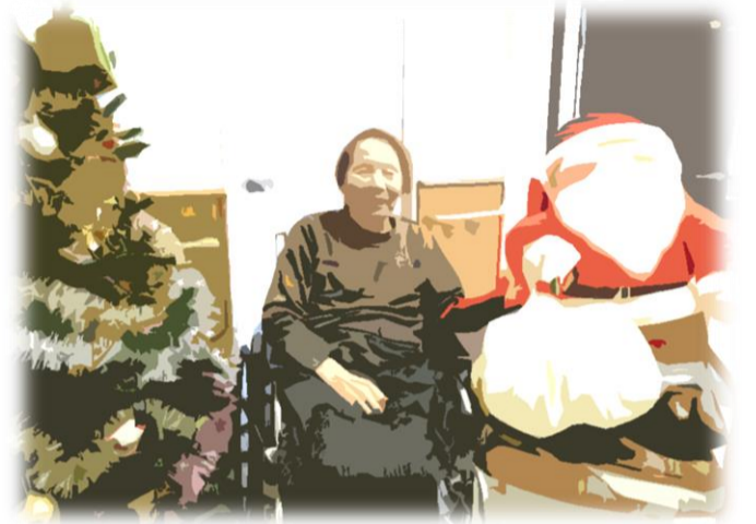
1階クリスマス装飾前にて