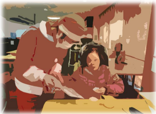
サンタの個別訪問

十二月二十五日にこもれびの郷のクリスマス会を行いました。本年も感染症対策を行い、安全のため集合型の行事としては行いませんでした。クリスマス会では、利用者様と職員がサンタとトナカイに扮した職員が館内をまわり、利用者様の皆様に写真を撮りました。その際に、お一人お一人丁寧な記念撮影をさせていただきます。賑やかな時間を共にすることが、利用者様の皆様に喜んでいただくことで、利用者の皆様に