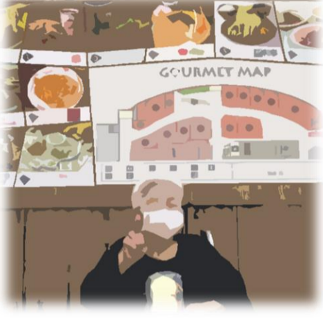
すてきな笑顔で穏やかな時間を

コロナ禍で外出は控えておりましたが、近隣のショッピングモールなどへの外出も徐々に再開しております。