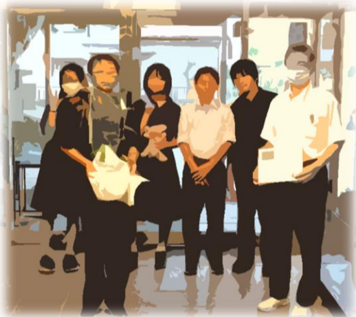
中学生の皆さんが来園

近隣の学校施設との交流を活かすに行っております。今回は最も近い秋多中学校の生徒さん達が自分達の育てた季節の「あさがお」をお持ちいただき交流会を行いました。利用者様はこのお花を見て季節を感じ、楽しむことができました。毎年行っている地域との大切な交流活動となっております。