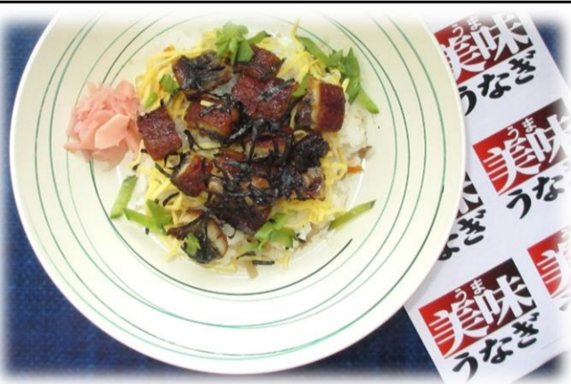
丑の日 うなぎちらし