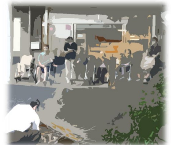
わらから立ち上る煙に・・・