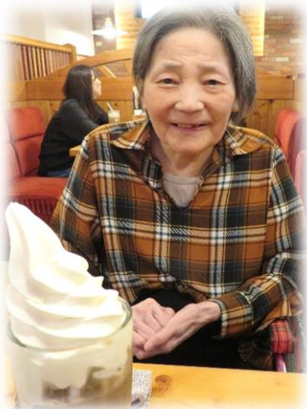
喫茶店にてお祝い

こもれびの郷では、利用者の皆様のお誕生日の月に、その方に合わせたバースデー企画を行っております。ご希望に応じて外出なども行っております。