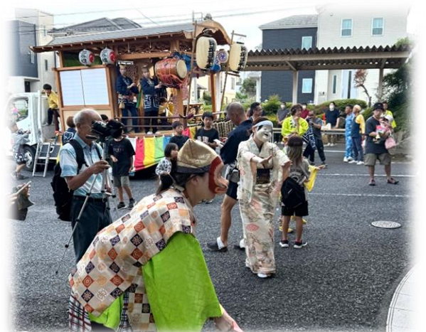
お囃子の踊り手が近くまで