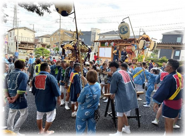
神輿やお囃子が場を盛り上げてくれました

連絡先：〒197-0825 東京都あきる野市雨間385-2 電話 042-550-3030 FAX 042-558-0756 発行者：社会福祉法人さくらぎ会・特別養護老人ホーム こもれびの郷・広報委員 http://www.komorebinosato.or.jp