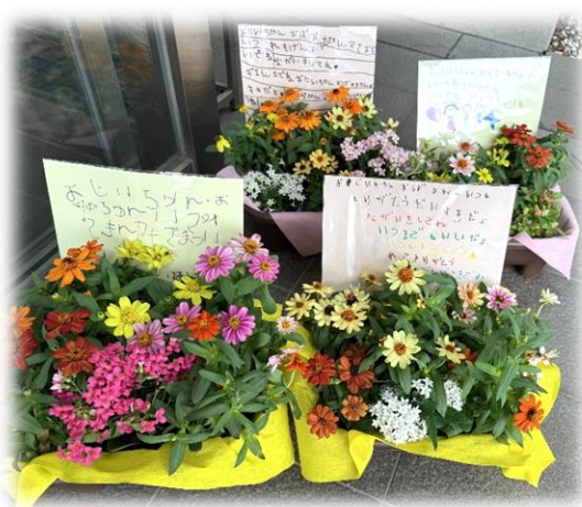
利用者さま、来客者さまが鑑賞

こもれびの郷と同じ法人が運営する「さくらぎ保育園」の園児さん達から、敬老の日のメッセージの入ったお花が届きました。たくさんの方が楽しむことができました。ありがとうございます。