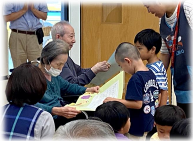
さくらぎこばん・保育園児童との交流

園児の歌や出し物を拝見し、最後は「肩たたき」もしていただきました。おみやげもいただき、楽しい時間を過ごすことができました。