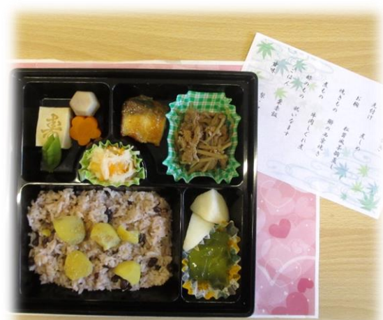
令和七年度 長寿を祝う会 祝い膳

○情報共有 コロナウイルス感染者数が増加しています。先月も感染者数が増えていましたので、人混みを避ける、人が多いところや密閉空間ではマスク着用、外から帰ったら手洗い・うがいなど、日常的な感染予防に努めましょう。