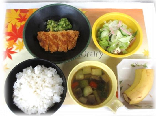
スポーツの日に提供した チキンカツ、スープ、サラダ、果物

厨房栄養士より 〇情報共有 寒暖差が激しい季節になりました。体調を崩さないようにしっかりと暖かくすることも大事ですが、寒いと疎かになりがちなのが換気です。せっかく部屋を暖かくしたのに、乾燥した空気が留まらずに暖かくて乾いた病原菌が増殖しやすい環境になります。 寒さ対策だけでなく、定期的な換気もして体調管理をしっかりとしましょう。