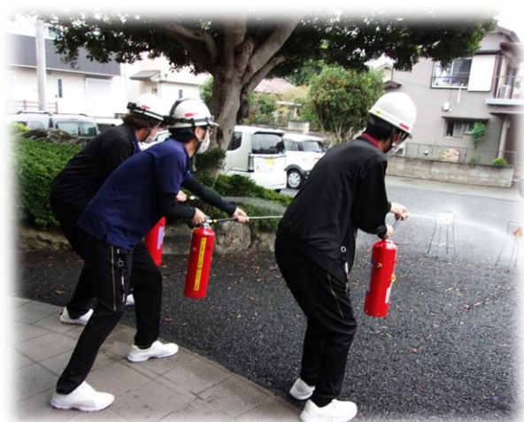
消火器を使って消火訓練

発行者：社会福祉法人さくらぎ会・特別養護老人ホーム こもれびの郷・広報委員 http://www.komorebinosato.or.jp