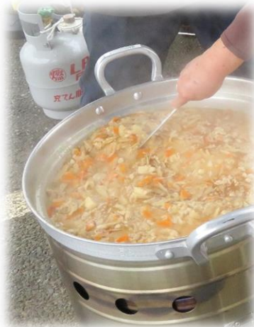
寒かったので格別に

今月の新聞でお知らせした、非常時の炊き出し訓練で供された、こもれびの郷特製の「豚汁」です。作る事自体が訓練なのですが、その非常時食を食べつことも体験としての訓練となりました。（おいしかったです。）