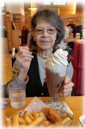
某有名喫茶店にて

ご本人様の体調やご家族の了解があれば、近隣への外出なども可能で。す。（インフルエンザ流行期は出来ない場合もございます。）