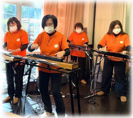
ダイナミックな演奏