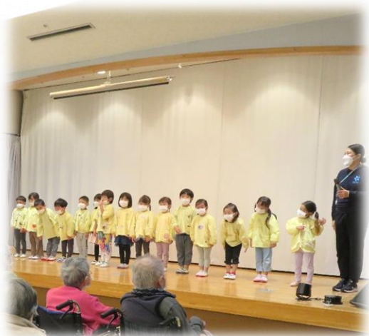
15人の保育園児が3階大ホールで

保育園との交流 こもれびの郷では、同法人が運営する保育園との交流を行っております。今回は「さくらぎこぼんの4歳児クラス・ももぐみの皆さんが来園され、歌と踊りを披露してくれました。 保育園においては小さな遠足のこもれびの郷には嬉しいお客さんの来園というレクリエーションになります。