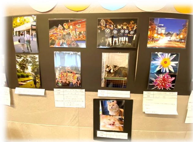
新企画・フォトコンテスト