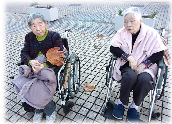
近隣のショッピングタウンに外出しました

こまねびの郷では、利用者の皆様のお誕生日の月に、その方に合わせたお祝いの催し、バースデー企画を行っております。 近隣への外出なども可能なのですが、ご本人様の体調や感染症の流行状況で、ホーム内での誕生日パーティーとなる場合もございます。