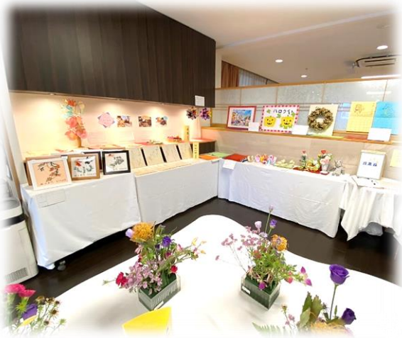
エントランスホールにて開催

第一弾として「フォトサークルあきる野」の皆様による写真展（12月14日午後〜来年1月22日まで）を開催いたします。