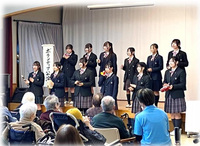
地域の中高生との交流の場にも

十一月八日（土）から、こもれびの郷一階ロビーにおいて恒例のこもれびの郷文化祭が行われ、会場には多くの作品が展示されました。出品された作品は利用者様や職員、その家族等が製作したもので、個人やグループ単位で出品していただきました。 また、別日には文化祭イベントとして、八王子の共立女子中高のコーラス部の公演が三階のホールで行われました。華やかな雰囲気、参加利用者の皆様の笑顔が印象的でした。