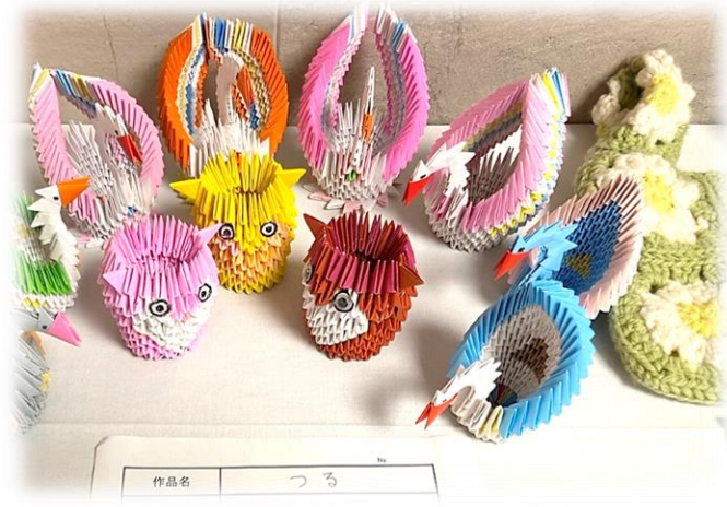
カラフルな作品が多数展示