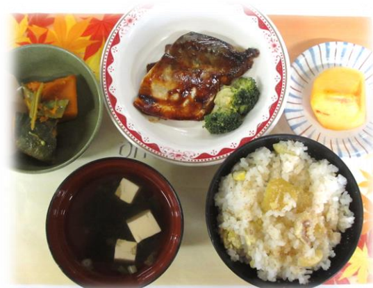
勤労感謝の日の「旬の献立」メニュー

○情報共有 朝晩が寒く、昼間は暖かいという様な寒暖差が激しい季節になってきました。これからだんだんと本格的な冬になるにつれてインフルエンザ、ノロウイルス、コロナウイルスと様々な病気が流行してきます。予防接種をしたり、マスクをしたり、普段の感染予防を疎かにしてしまつと危険です。外から帰ったら手洗い・うがい・手指の消毒！基本の徹底が皆さんを守ります。健康管理をしっかりして楽しい年末年始を迎えましょう。