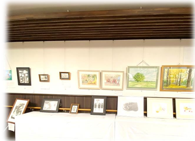
絵画・イラスト作品が充実