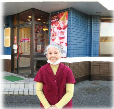
近くのレストランへ外出

こもれびの郷では、利用者の皆様のお誕生日の月にその方に合わせたバスデー企画を行っております。近隣への外出なども可能です。が、ホーム内での誕生パーティーが人気となっております。一年に一度、利用者の皆さまへの感謝の気持ちを表する場にもなっております。