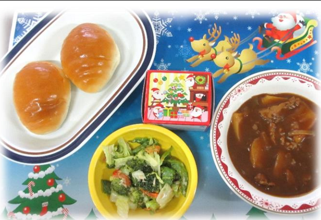
クリスマスメニュー (ロールパン、シチュー、サラダ、ケーキ)

○情報共有 現在、東京都では感染性胃腸炎（ノロウイルスを含む）が流行しています。手洗い・うがいを忘れず、清潔にする・換気をして新鮮な空気を取り組む・体調を維持すること、毎日できる感染症予防を継続して、感染症を予防していきましょう。