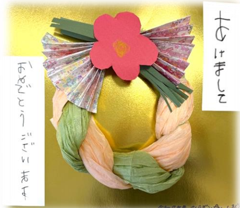
さくらぎこばん・しろぐみさんより

連絡先：〒197-0825 東京都あきる野市雨間385-2 電話 042-550-3030 FAX 042-558-0756 発行者：社会福祉法人さくらぎ会・特別養護老人ホーム こもれびの郷・広報委員 http://www.komorebinosato.or.jp