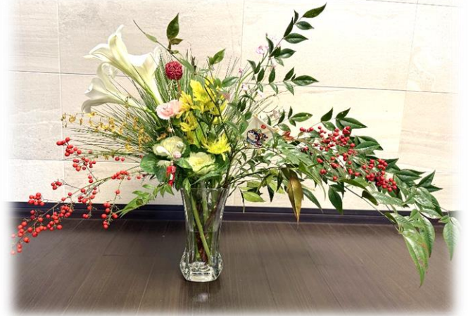
こもれびの郷・看護師さんの力作

あけまして おめでとう ございます。 本年もよろしく お願いします。 特別養護 老人ホーム こもれびの郷 職員一同