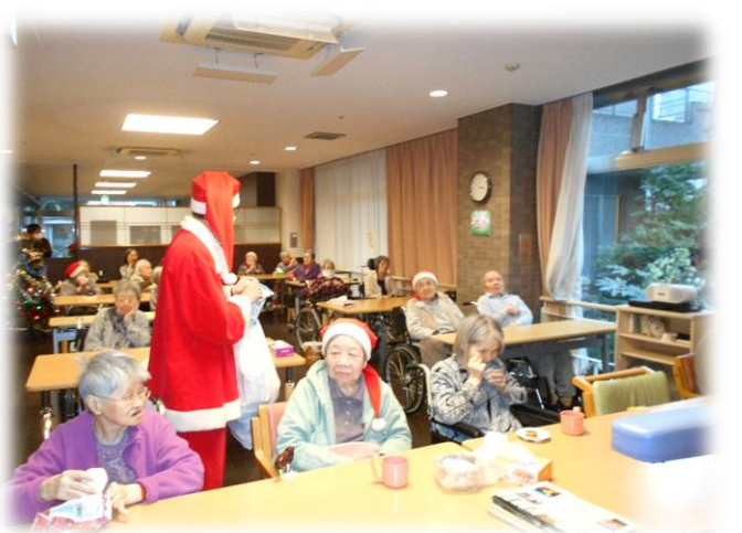
サンタさんがやってきました

十二月二十五日にこもれびの郷のクリスマス会を行いました。本年も感染症対策を行い、安全のため集合型の行事としては行いませんでした。サンタとトナカイに扮した職員が館内をまわり、利用者の皆様と記念写真を撮りました。その際にプレゼントも配らせていただき、その後はお一人お一人と丁寧に記念撮影をさせていただきました。賑やかな時間を共にすることで、利用者の皆様に楽しんで頂けた様子でした。