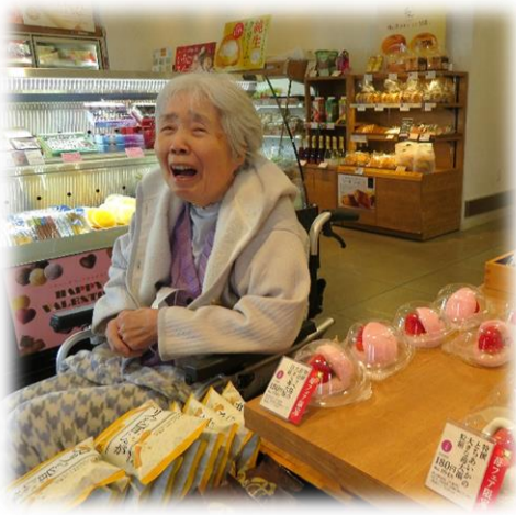
ショッピングセンターにて

こもれびの郷では、利用者の皆様のお誕生日の月にその方に合わせたお祝い、バースデー企画を行っております。趣旨としては、こもれびの郷をご利用いただいている大切なお客様でもある皆様に、年に一回日頃の感謝を込めてお祝いをさせていただくというものです。企画は利用者様のお部屋の担当をさせていただいている職員が行い、どの様な形で行えば喜んでいただけるか。」を考えて事を運んでおります。