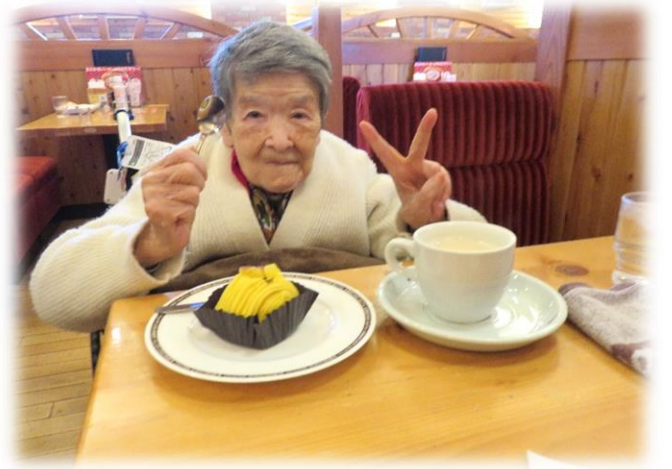
ポーズをとってくださいました

こもれびの郷では、利用者の皆様のお誕生日の月にその方に合わせたお祝い、バースデー企画を行っております。趣旨としては、こもれびの郷をご利用いただいている大切なお客様でもある皆様に、年に一回日頃の感謝を込めてお祝いをさせていただくというものです。企画は利用者様のお部屋の担当をさせていただいている職員が行い、どの様な形で行えば喜んでいただけるか。」を考えて事を運んでおります。