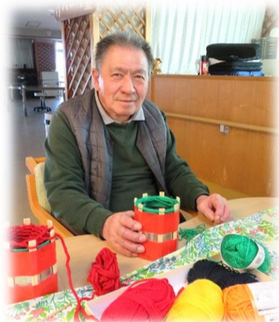
手芸クラブの風景