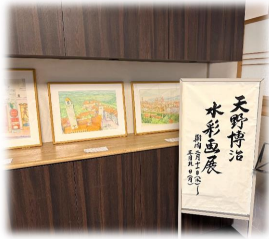
大好評の催しとなりました

沢山の水彩画で、ギャラリーがとても華やかな空間となりました。作品展示募集中です。