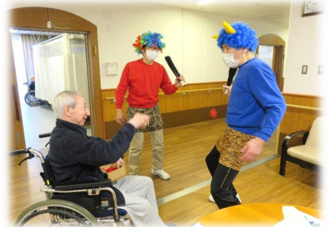
今年は割とベテランの鬼が登場

まだまだまだ成熟した関係とは言えないかもしれませんが、お互いの立場を尊重しながら一緒に毎日の仕事に向きあってまいります。