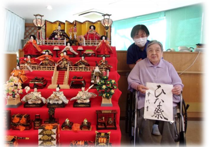
3階大ホールにお雛様を飾りました。

こもれびの郷の雛飾りは、女性職員から寄付していただいたかなり高価なもので見ごたえがありました。