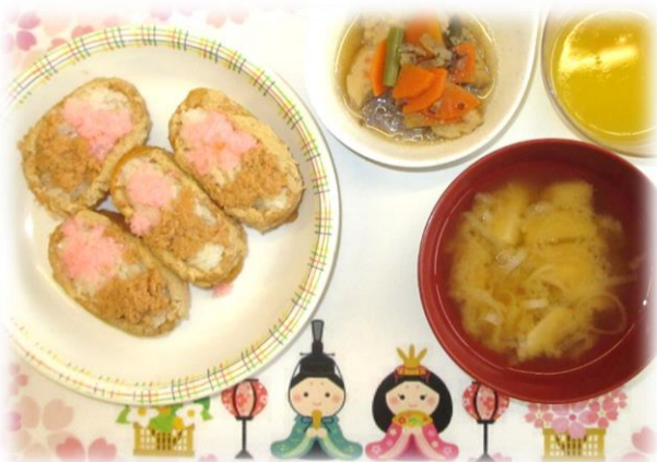
3月3日ひな祭り いなり寿司、味噌汁、鶏しんじょうの煮物、ひな祭りゼリー

今年例年と比べ花粉がとても多く、花粉症の症状に苦しんでいる方も多いと思います。本人は花粉症だと思っても、実は風邪や感染症で感染が広がってしまったりという事例は珍しくありません。激しい咳やくしゃみが出ているときは病院に行き診察を受けるようにしましょう。