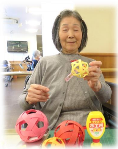
手芸クラブの風景