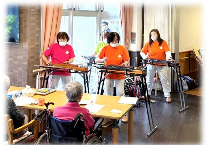
ダイナミックな演奏にウットリ