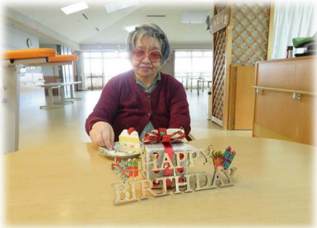
3階大ホールにてお誕生会

こもれびの郷では、利用者の皆様のお誕生日の月にその方に合わせたお祝い、バースデー企画を行っております。企画は利用者様のお部屋の担当をさせていただいている職員が行い、「どの様な形で行えば喜んでいただけるか。」を考えて事を運んでおります。