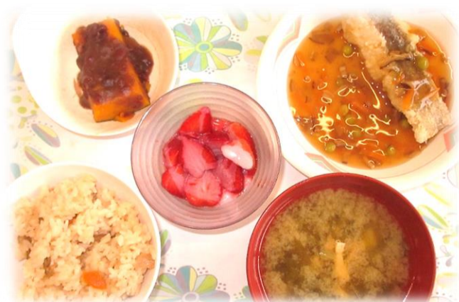
5月6日憲法記念日のメニュー 五目御飯、鱈のあんかけ、いちご