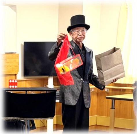
軽妙なトークも素敵

こもれびの郷では地域の演芸団体の方々の協力をいただき、様々な公演を行っていただいております。ボランティアの皆様は、福祉施設への訪問回数も多く経験されており、「どの様な演目にすれば利用者の皆様が喜ばれるか」、「どの様な進行にすれば、利用者の皆様が気持ちよく参加できるか」といった利用者ファーストを心掛けておられ、毎回楽しい会を催していただいております。