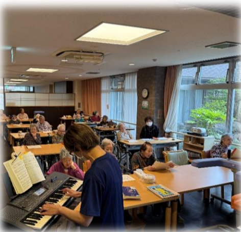
今日も職員が特技を活かし活躍

書道師範やお花の資格を持っている職員もいます。シフトの調整などもあり、なかなか実現できない場合もあるのですが、今後も職員の特技を活かし活躍