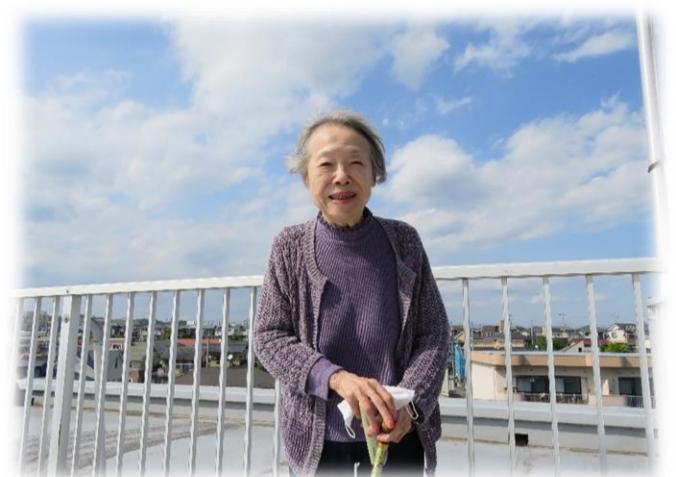
お外での記念写真