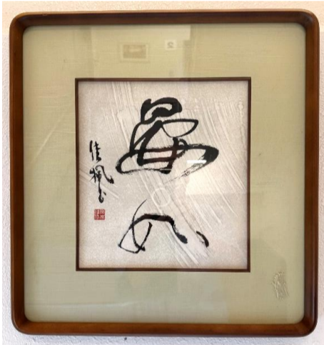
何やらいい雰囲気です

こもれびの郷の館内には、数多くの美術品が飾られております。高価なもの一つもございませんが、どれも味わい深いです。 これは施設創始者の奥様の書です。「安心」と書いてあります。