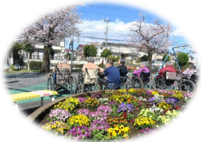
整備された素敵な公園

地元の皆さんが管理されている公園では、満開の桜と元気にあそぶ児童の皆さんを見ることができました。取組期間は終了しましたが、余暇活動やリハビリの時間を利用して今後少しづつ続けてまいります。