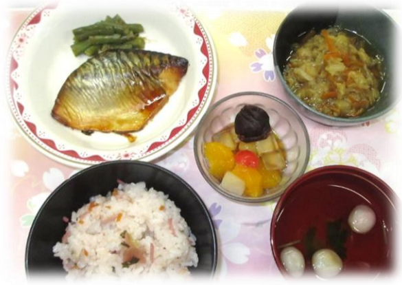
さくらの日メニュー：桜御飯、澄し汁、鯖の味醂醤油焼、白菜ととろろ煮浸し、あんみつ風

〇情報共有 今年例年と比べ花粉がとても多く、花粉症の症状に苦しんでいる方も多いと思います。 本人は花粉症だと思っても、実は風邪や感染症で感染が広がってしまったという事例は珍しくありません。激しい咳やくしゃみが出ているときは診察を受けるようにしましょう。