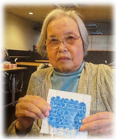
お見事な出来栄え

こもれびの郷では月に1〜2回、手芸クラブを行っております。4月はビニールひもを使い、コースター織りを行いました。あまり難しい作業にならないように職員が工夫した器具を使い、ゆっくりとした時間を過ごしました。あまり多くの方は参加できませんが、その分参加者の方にあつた「楽しさ」を提供できるように担当職員が一生懸命工夫してくれています。